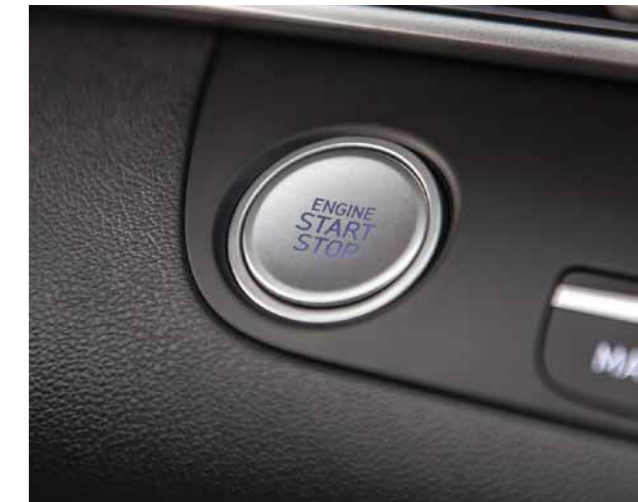
Khởi động bằng nút bấm