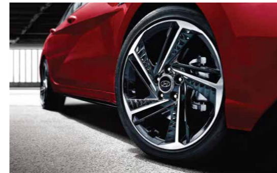
Vành hợp kim 18 inch