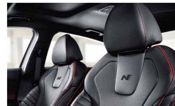
Ghế da thể thao N Line