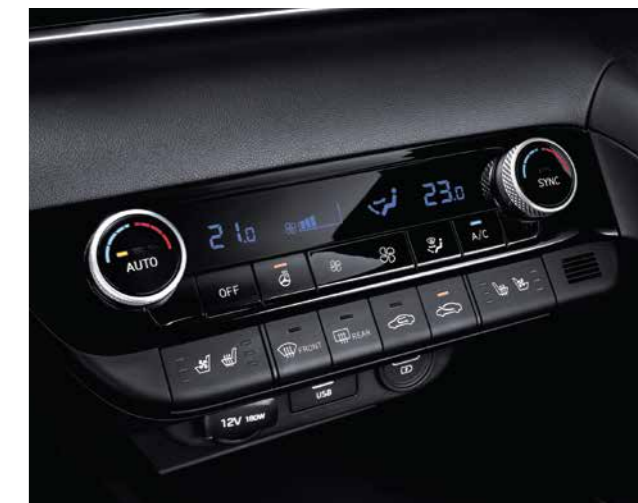
Điều hòa tự động