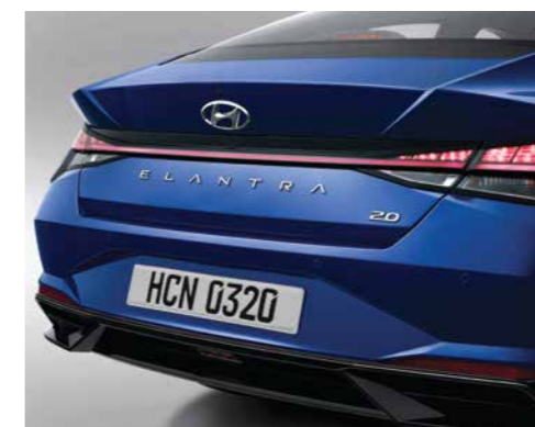
Cụm đèn hậu dạng LED (Phiên bản 1.6 AT/2.0 AT/N Line)