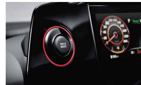
Nút bấm chuyển chế độ lái