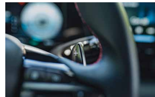
Lẫy chuyển số sau vô lăng