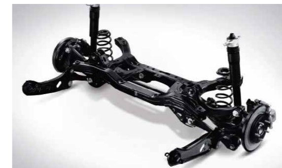
Hệ thống treo sau liên kết đa điểm