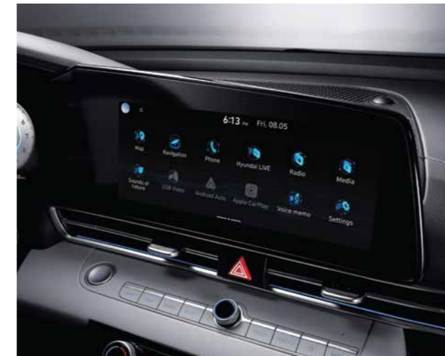
Màn hình giải trí 10.25 inch

Với các đường nét đơn giản nhưng đầy tính thể thao gợi cảm, All New Elantra mang đến một không gian nội thất hài hòa cùng không khí thể thao tràn ngập trong khoang lái