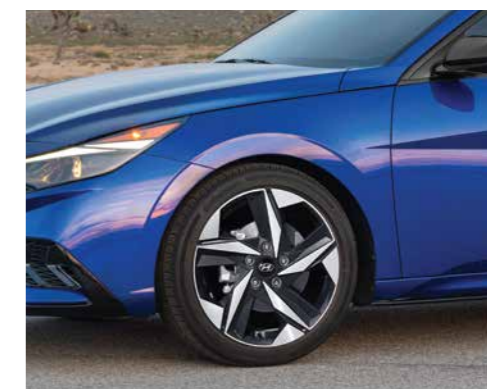
Vành hợp kim 17 inch 2 tone màu (Phiên bản 2.0 AT)