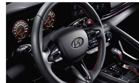
Vô lăng 3 chấu thêu chỉ đỏ