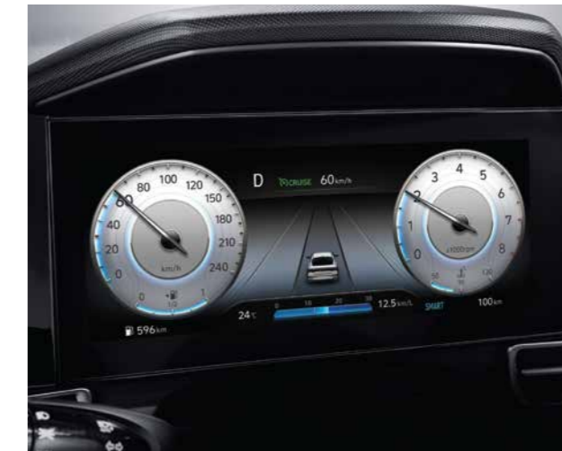
Màn hình thông tin digital 10.25 inch