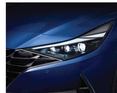
Đèn chiếu sáng LED (Phiên bản 1.6 AT/2.0 AT/N Line)

Thiết kế khác biệt với phần lưới tản nhiệt “Parametric Dynamics” tạo thiết kế mạnh mẽ, góc cạnh, thể thao cho Elantra