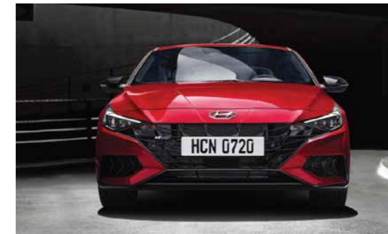
Cản trước với hốc hút gió lớn