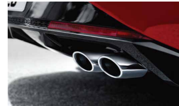
Chụp ống xả kép thể thao