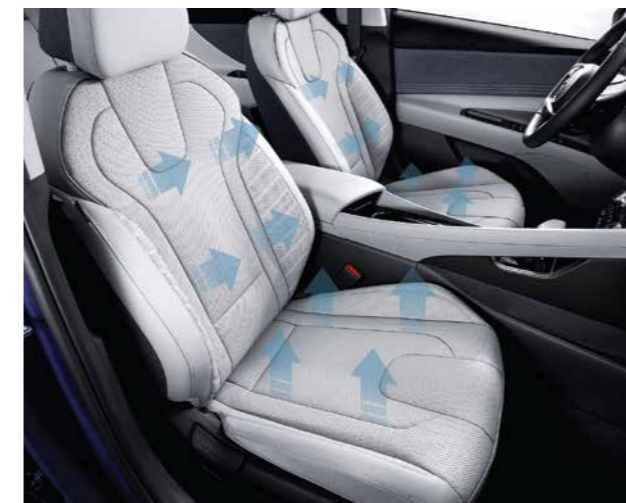
Sưởi và làm mát ghế