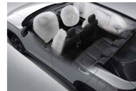
6 túi khí