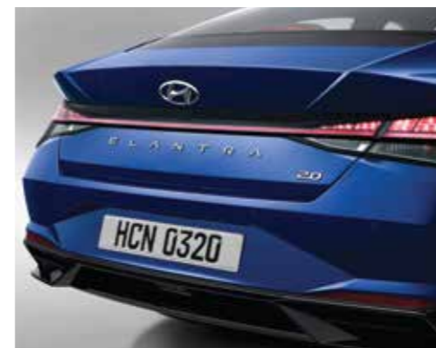
Cụm đèn hậu dạng LED (Phiên bản 1.6 AT/2.0 AT/N Line)