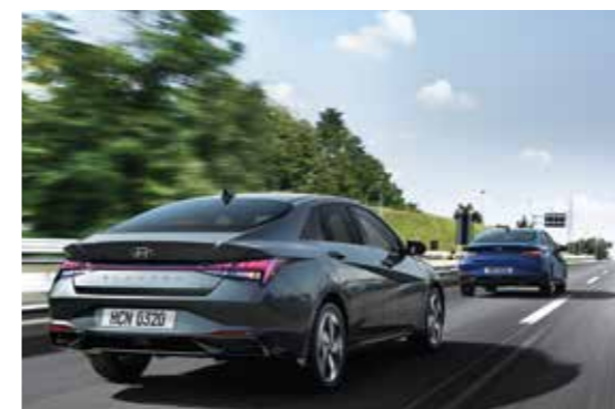
Điều khiển hành trình