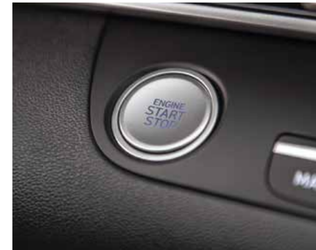
Khởi động bằng nút bấm