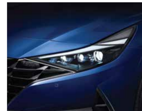
Đèn chiếu sáng LED (Phiên bản 1.6 AT/2.0 AT/N Line)

Thiết kế khác biệt với phần lưới tản nhiệt “Parametric Dynamics” tạo thiết kế mạnh mẽ, góc cạnh, thể thao cho Elantra