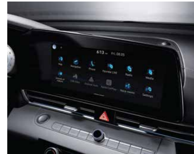
Màn hình giải trí 10.25 inch

Với các đường nét đơn giản nhưng đầy tính thể thao gợi cảm, All New Elantra mang đến một không gian nội thất hài hòa cùng không khí thể thao tràn ngập trong khoang lái