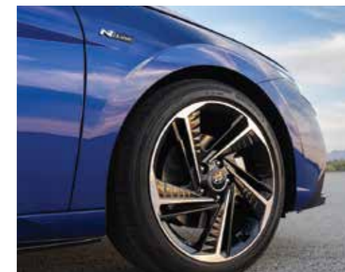
Vành hợp kim 18 inch 2 tone màu (Phiên bản N Line)