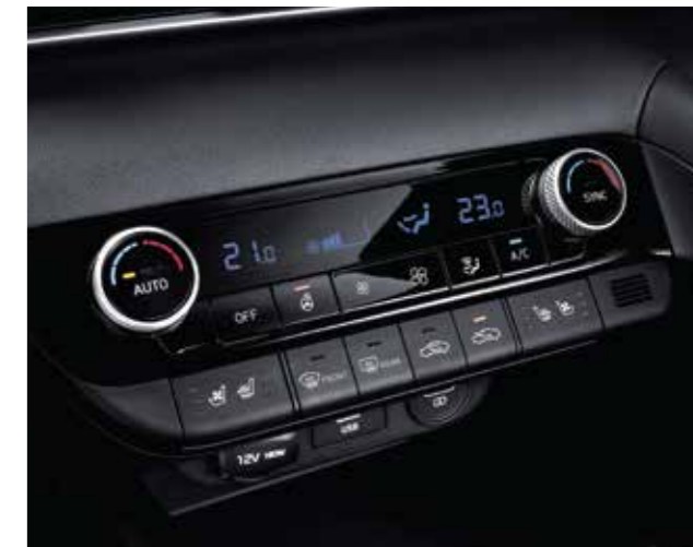
Điều hòa tự động