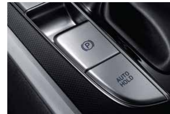
Phanh tay điện tử