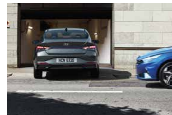
Cảm biến lùi