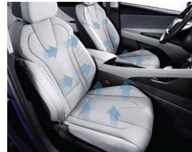
Sưởi và làm mát ghế