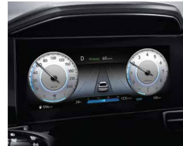
Màn hình thông tin digital 10.25 inch