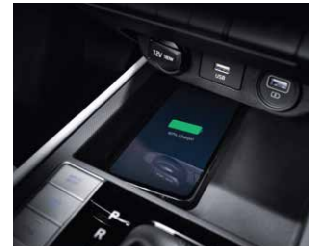
Sạc không dây