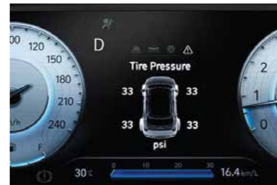
Hệ thống cảm biến áp suất lốp

Elantra hoàn toàn mới được trang bị khung gầm hoàn toàn mới để đảm bảo sự chắc chắn đi cùng hệ thống an toàn. Bên cạnh đó, động cơ Smartstream 1.6 T-GDi mới giúp Elantra trở thành chiếc xe mạnh mẽ nhất phân khúc