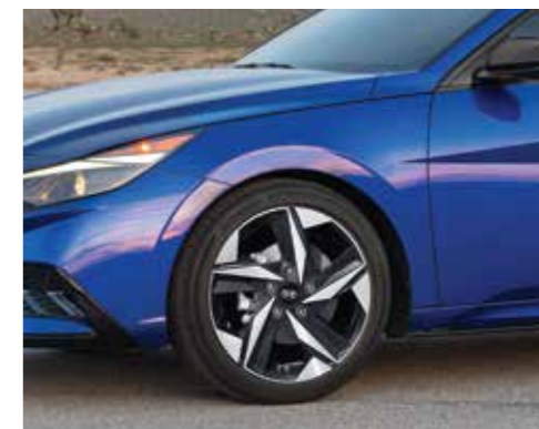
Vành hợp kim 17 inch 2 tone màu (Phiên bản 2.0 AT)