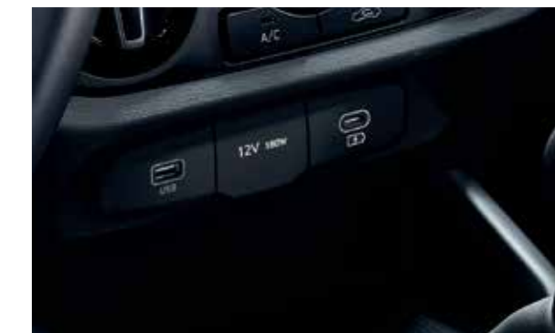
Cổng sạc Type C