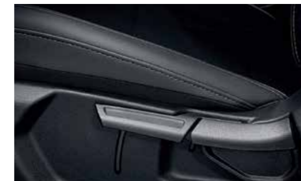
Ghế lái điều chỉnh 6 hướng