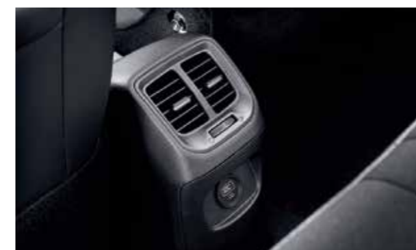
Cửa gió điều hòa hàng ghế thứ 2