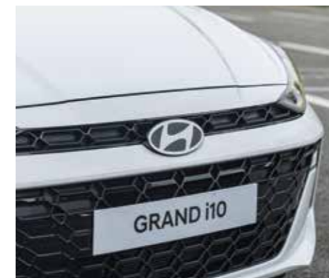
Lưới tản nhiệt màu đen bóng

Thiết kế mới mẻ, kích thước nhỏ gọn tạo nên vẻ ngoài tươi mới, trẻ trung, tự tin và cá tính.