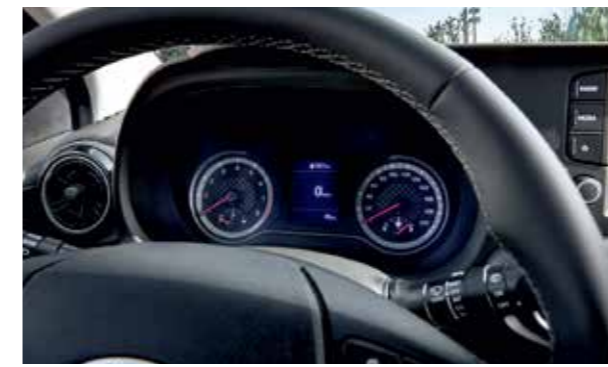
Màn hình thông tin 3.5 inch

Nội thất hiện đại, hoàn thiện kết hợp với không gian rộng rãi làm cho những chuyến đi dài trở thành một trải nghiệm thú vị.