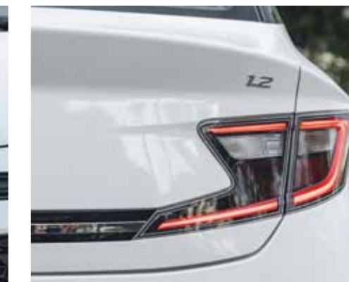
Cụm đèn hậu LED