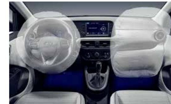
Hệ thống 4 túi khí