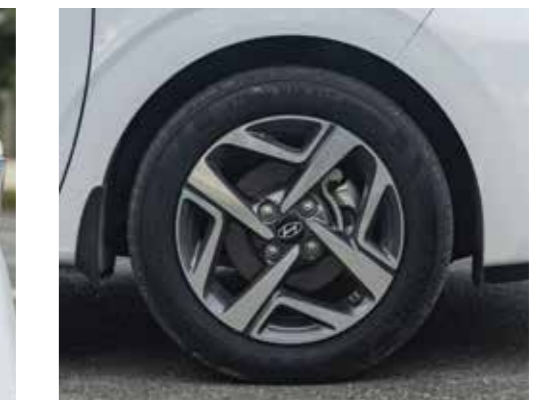
Mâm xe hợp kim 15" thể thao