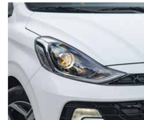
Đèn chiếu sáng Halogen projector