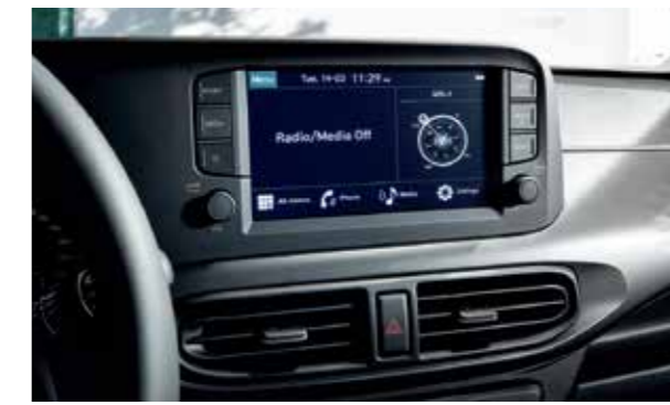
Màn hình giải trí 8 inch