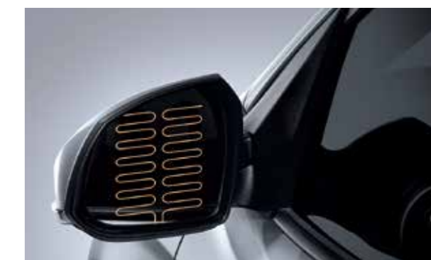
Gương chiếu hậu chỉnh điện gập điện, sấy điện