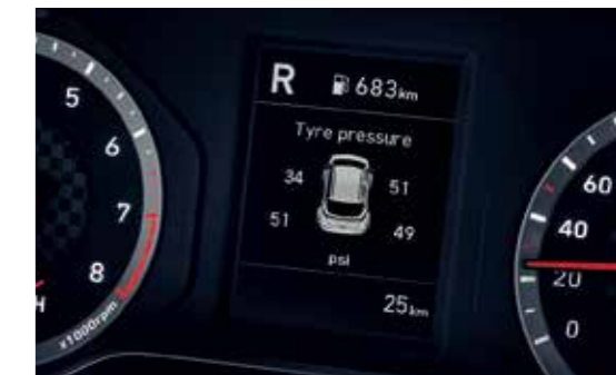
Cảm biến áp suất lốp TPMS