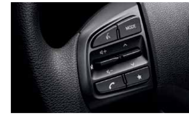
Cụm điều chỉnh media tích hợp nhận điện giọng nói