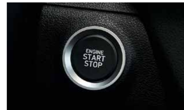
Khởi động bằng nút bấm