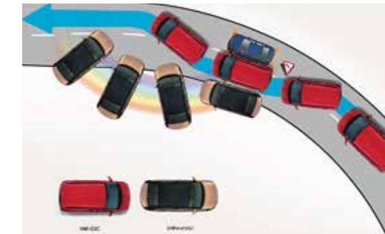
Hệ thống cân bằng điện tử ESC