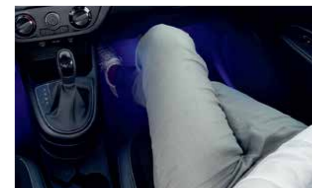
Đèn nội thất