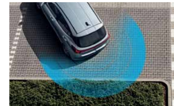
Cảm biến lùi