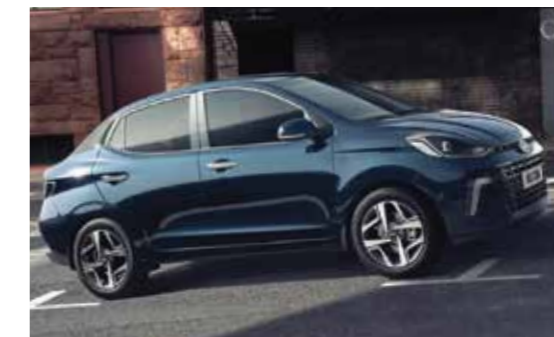
Hệ thống hỗ trợ khởi hành ngang dốc HAC