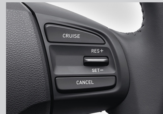
Điều khiển hành trình