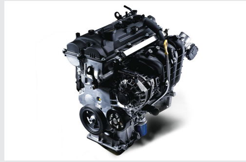
Động cơ Kappa 1.2L mang đến khả năng vận hành êm ái, ổn định cùng với khả năng tiết kiệm nhiên liệu nhưng vẫn đáp ứng được nhu cầu vận hành của khách hàng.