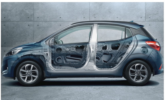
Hệ thống khung mới cứng vững hơn với thép cường độ cao AHSS