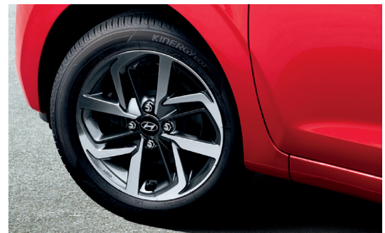
Hệ thống cảm biến áp suất lốp