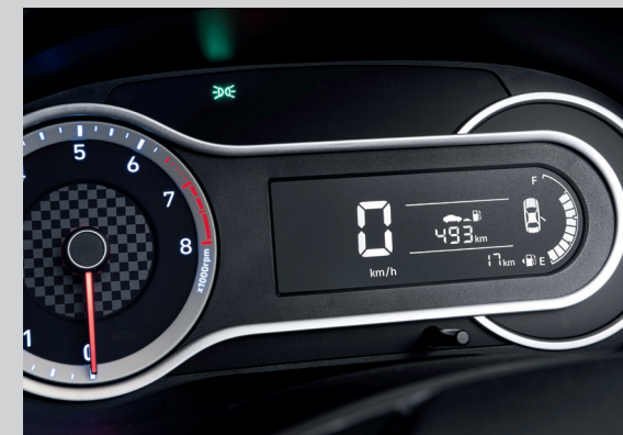
Màn hình thông tin thiết kế thể thao