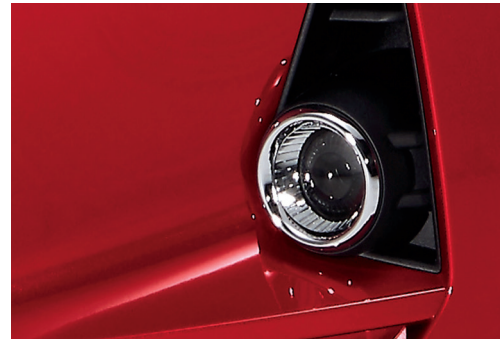
Đèn sương mù tích hợp trên cản trước thể thao