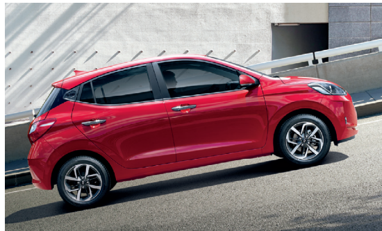
Hệ thống hỗ trợ khởi hành ngang dốc tích hợp với cân bằng điện tử