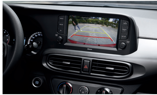
Camera lùi hỗ trợ đỗ xe