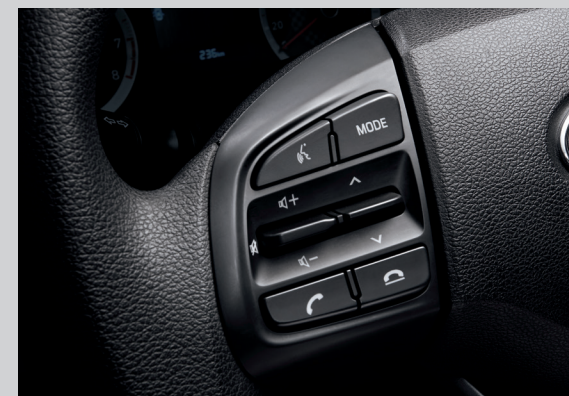
Cụm điều chỉnh media tích hợp nhận diện giọng nói