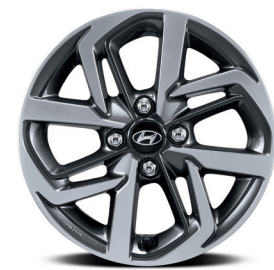
Vành hợp kim 15 inch cao cấp tạo hình trẻ trung