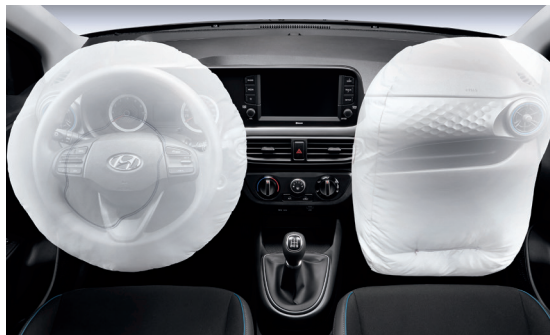
Hệ thống an toàn 2 túi khí