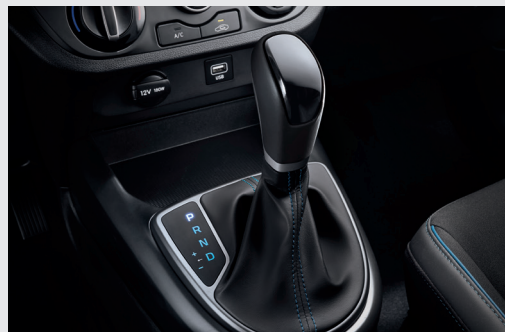
Hộp số tự động 4 cấp

Mang đến khả năng vận hành bền bỉ và tiết kiệm nhiên liệu