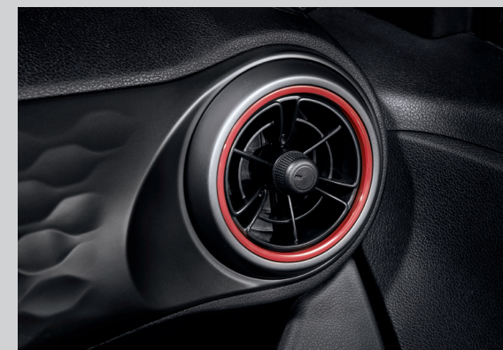
Cửa gió điều hòa dạng tua bin với 2 tông màu trẻ trung