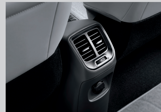
Cửa gió điều hòa hàng ghế thứ 2