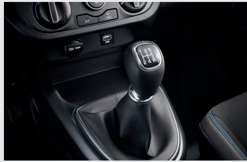
Hộp số sàn 5 cấp

Mang đến khả năng vận hành bền bỉ và tiết kiệm nhiên liệu