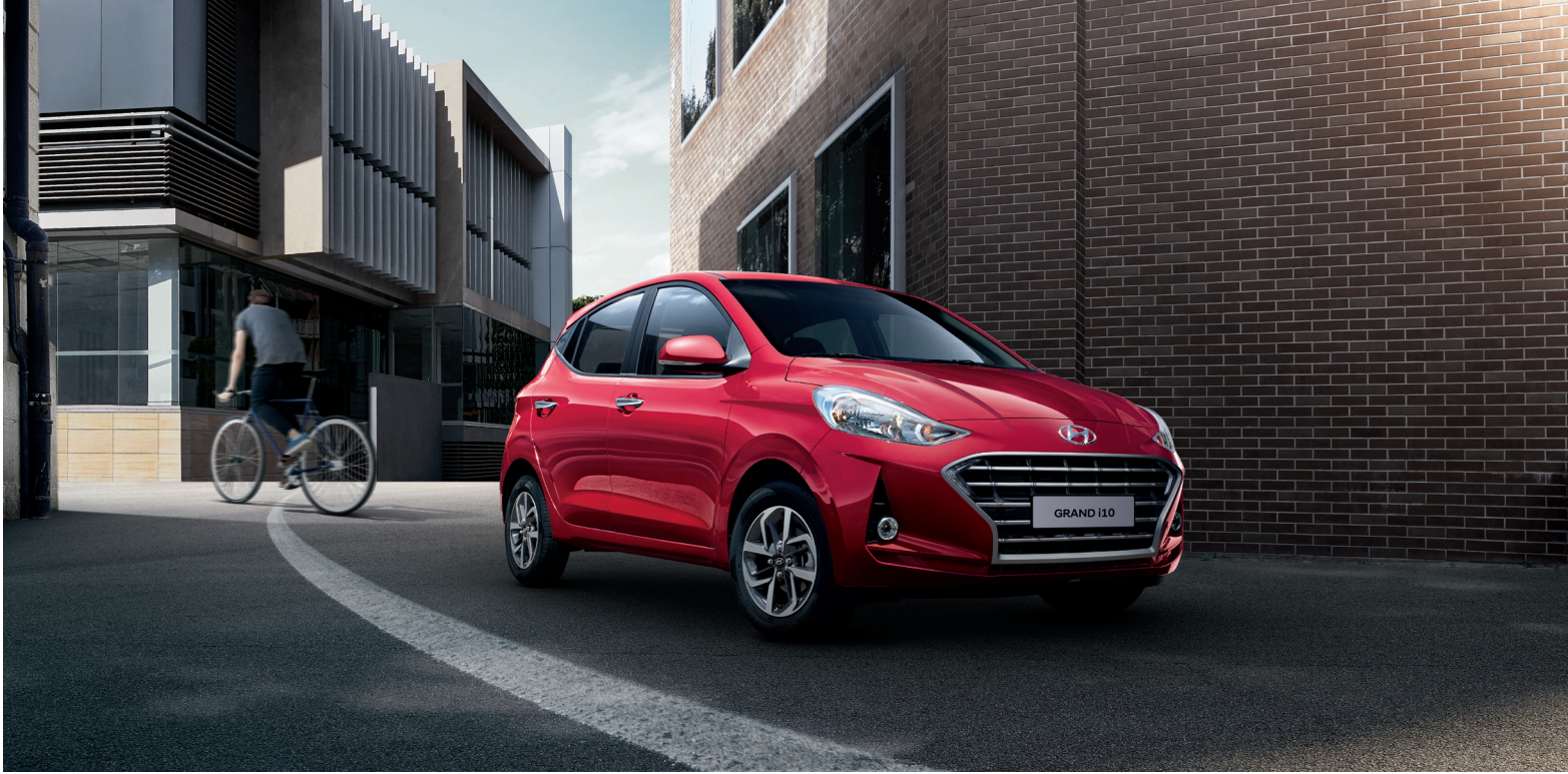
Tiên phong trong thiết kế với các đường nét thể thao, trẻ trung cùng mặt lưới tản nhiệt Crom tạo ra khí chất người dẫn đầu.