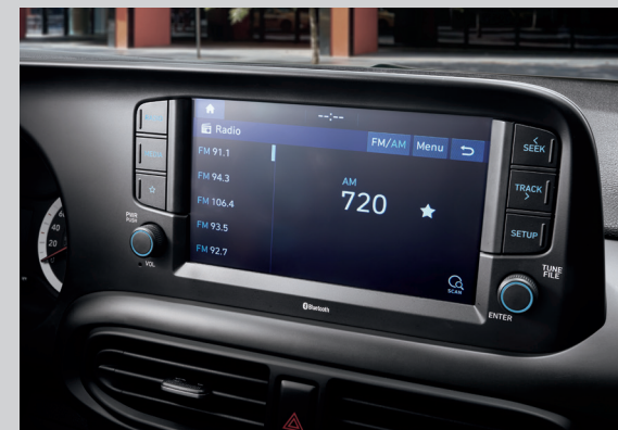
Màn hình giải trí 8 inch

Khoang nội thất của All new Grand i10 là tất cả những gì bạn cần. Đó là sự rộng rãi của không gian kết hợp cùng sự tỉ mỉ, tinh tế trên các chi tiết cùng các tiện ích vượt tầm phân khúc.