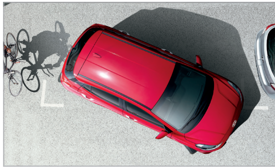
Cảm biến va chạm phía sau